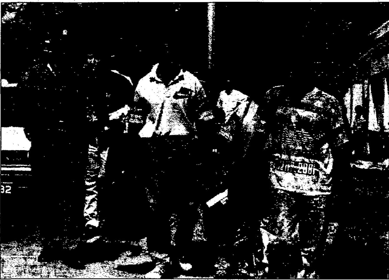
قوات شرطة سريلانكية تقوم عائلة عراقية اعتمدت على كيرلومي بمطالبة بالحصول على اللجوء السياسي